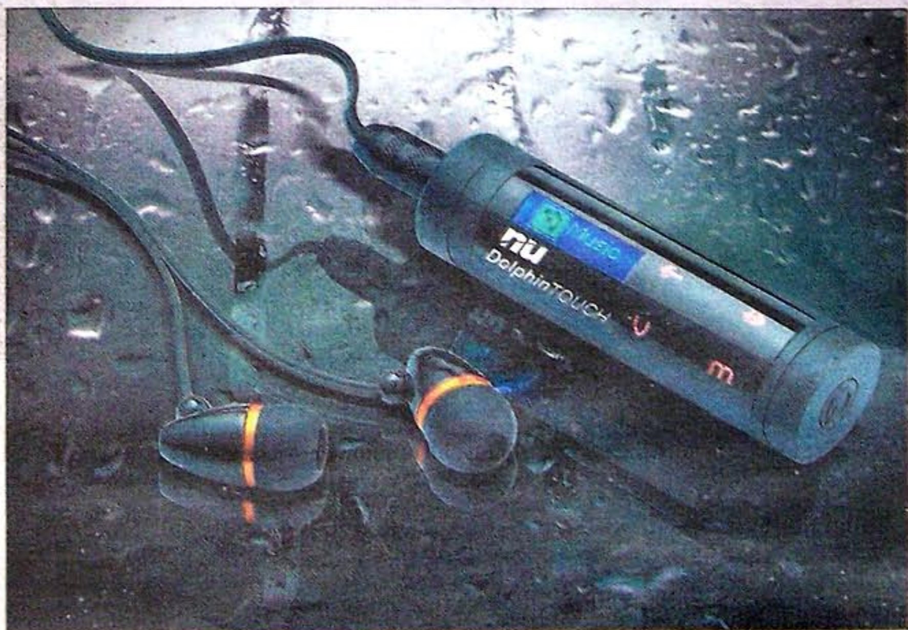
Dolphin Touch, a prueba de inundaciones.

Me ducho, y me jacuzzi, con él, incluso me tiro a la piscina mientras pasan por mi cerebro imáge-