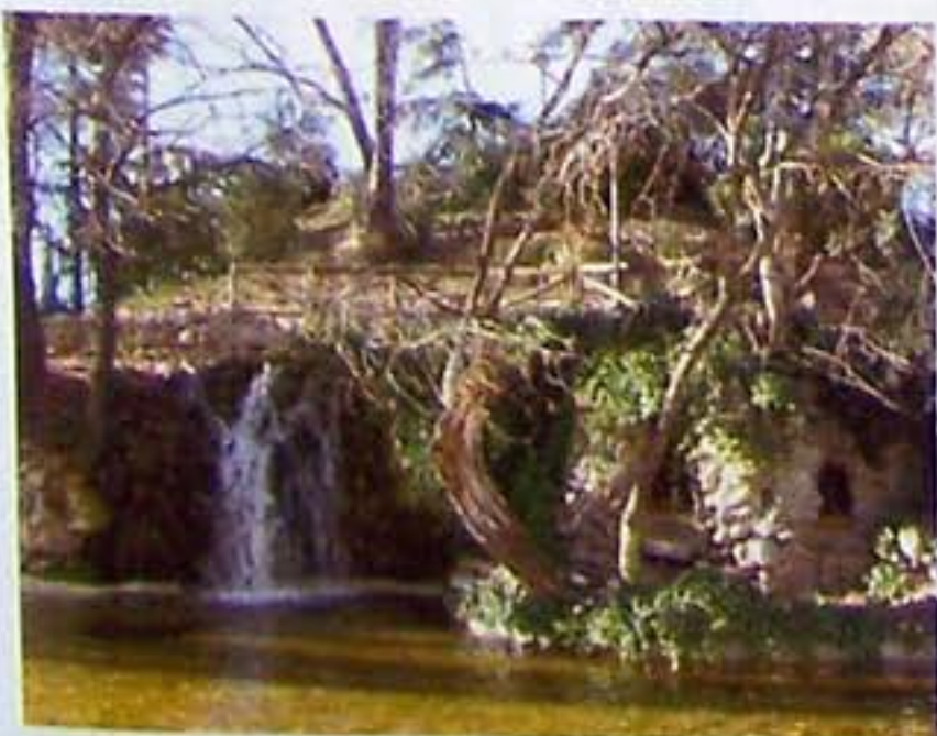
En exteriores el rendimiento de la cámara es bueno, aunque tiende a quemar las luces altas.

La X-8 Sport cuenta con la mayoría de las tecnologías que se han incorporado a las últimas compactas. Entre ellas destacan la detección de rostros y sonrisas y la eliminación de ojos rojos en la propia cámara. Su pantalla de 2,5" se ve claramente tanto